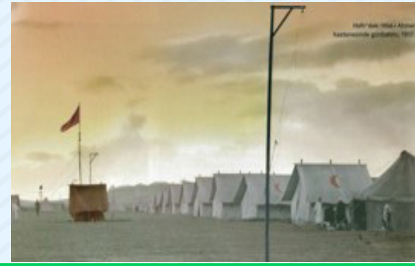
I. Dünya Savaşı (Sağlık Hizmeti, Para Yardımı)