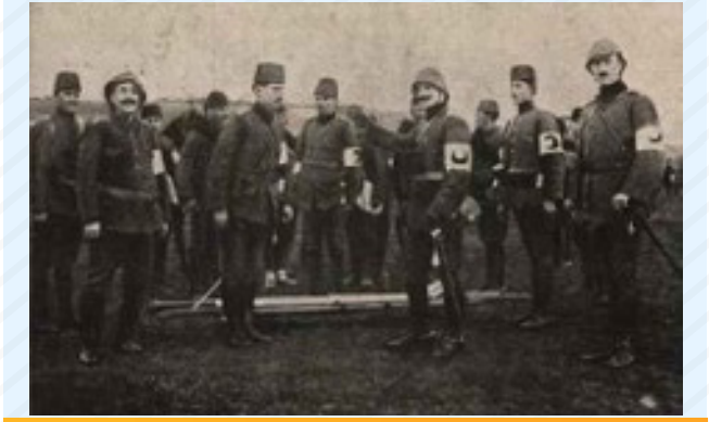
Kurtuluş Savaşı (Hastane, Gıda, Giyim, Esir Asker Değişimi, Göçmenlere Yardım)