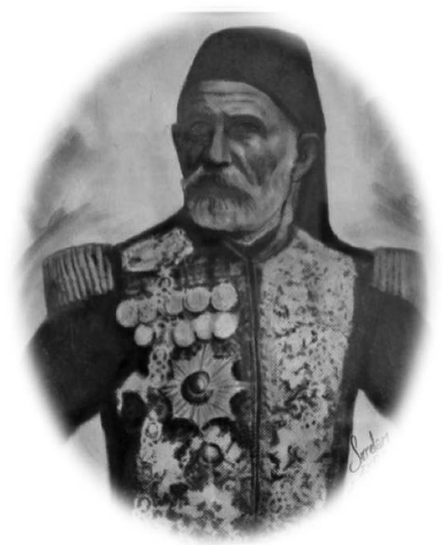
Serdar-ı Ekrem Ömer Paşa (1806-1871)