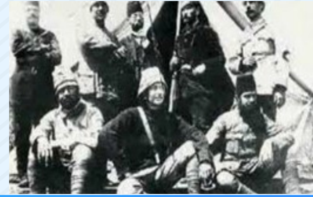
Trablusgarp Savaşı Balkan Savaşları