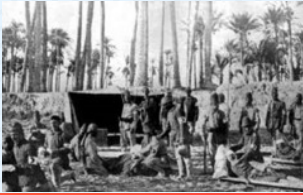
Osmanlı-Rus Savaşı (Hilal ambleminin ilk kez kullanımı)